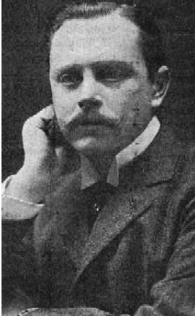
Princ Pierre d'Arenberg, rok 1909 prezident Casting-Club de France

Rybolovná technika se objevuje v 19. století, kdy se muškaření stává velice populárním způsobem rekreačního rybaření. Na rybářských veletrzích se pořádaly akce, na kterých se muškaření předvádělo. Zanedlouho byl první závod na světě. V severní Americe se závody konaly pravidelně již od roku 1861. Anglie Ameriku následovala, v roce 1881 dokonce proběhla první národní soutěž. První celostátní soutěž v Americe se uskutečnila v roce 1893.