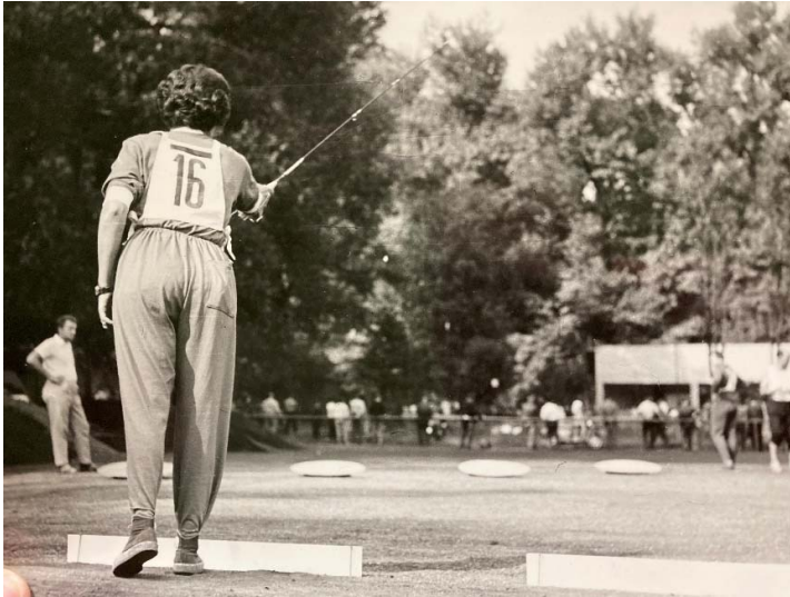
Zátěž skish v 60. letech

Zátěž skish se vyskytovala v různém provedení v obou organizacích. Na soutěžích organizace ICF byly terče upevněny na vodní hladině a házelo se na ně z mola. Jednalo se o simulaci lovu přívlačí na lodi.