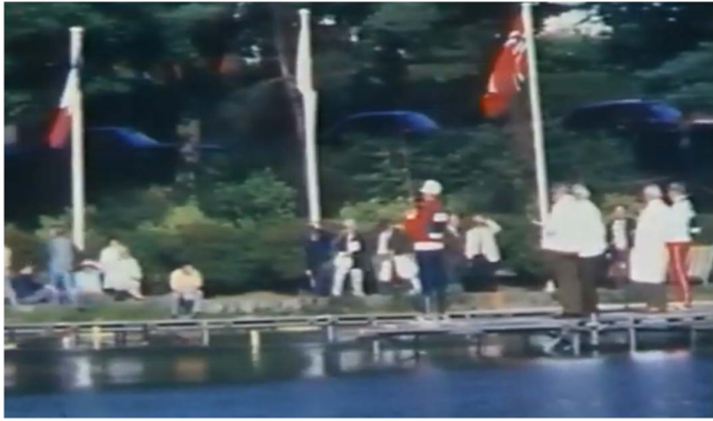
Mistrovství světa v roce 1973, Scarborough, Velká Británie

Disciplína Multi skish existovala ryze v organizaci ICF. Poprvé ji můžeme najít ve výsledcích mistrovství světa v roce 1960 (Švýcarsko). Házeno se zátěží 17,72g.