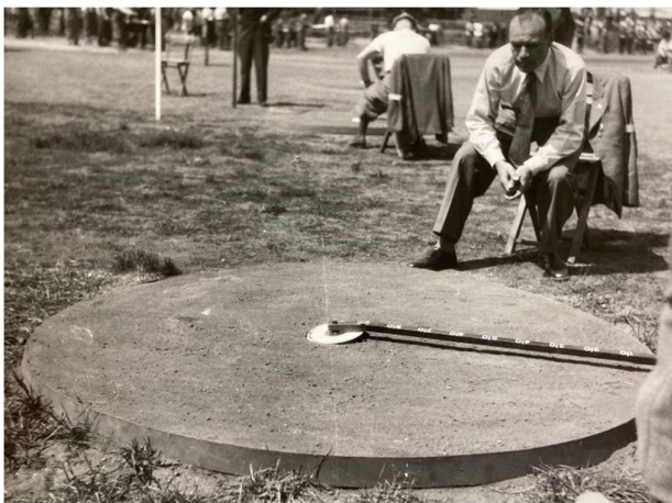
Hod kovovou zátěží z 25 metrů na hliněný terč, rok 1950. Měřila se vzdálenost od středu terče.

Po pravidelných úspěších ženského i mužského pětiboje se reprezentace začala