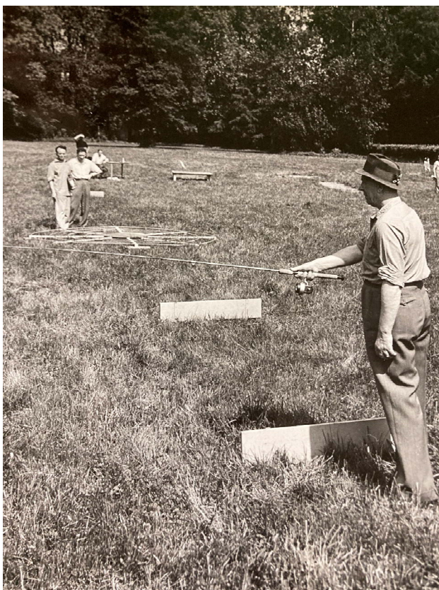
Mistrovství ČRS, ukázka disciplíny dle mezinárodních pravidel

Disciplína Zátěž arenberg se v Československu představila na mistrovství ČSR v rybolovné technice v Praze roku 1958. Jednalo se o disciplínu organizace CIPS. Druhá existující organizace (ICF) disciplínu Zátěž arenberg neměla.