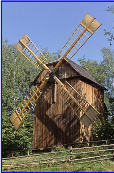
Větrný mlýn Kladník